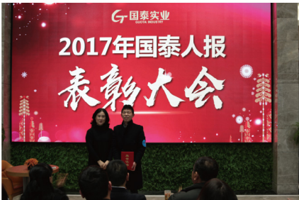
闻总颁发【国泰人报最具品质奖】