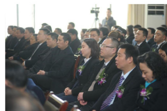
（参会人员认真聆听彭总工作指示）

本次会议还举行了2018年目标责任书签字仪式。通过签约仪式，进一步明确工作职责，厘清工作思路，提高责任意识，增强执行力度，齐心协力推动各项工作再上新台阶。