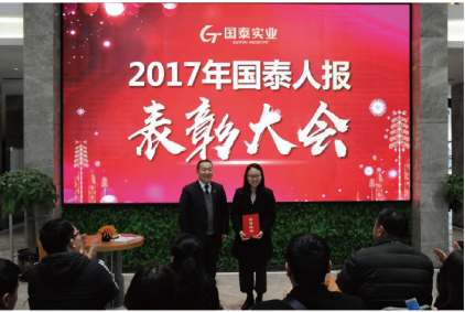
王总颁发【国泰人报感谢奖】