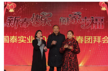
—国泰实业总公司 品牌部

2018年，国泰实业将继续不忘初心，牢记使命，以五大板块核心基础为依托，积极开拓创新，坚持以人为本，不忘初心，顺应时代发展的需求，保障企业稳定、健康发展，将点亮城市梦想作为我们不懈努力的使命。